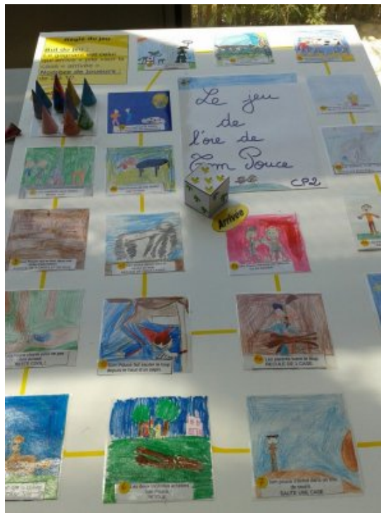
un jeu de l'oie créé par une des classes de CP

Version de Tom Pouce anglaise racontée par les élèves