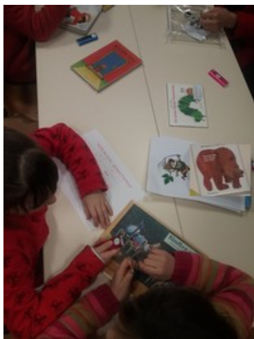
Atelier "balado" : lecture offerte d'albums enregistrés par des assistants par le biais d'un baladeur.

Puis, les élèves sont réunis par groupes multi niveaux, pour participer à différents ateliers : exposés autour de la culture allemande, lecture de contes (Croix Luizet) ou d'albums (J Racine), découverte de peintres allemands (Croix Luizet), atelier de bricolage mené en allemand (J Racine).